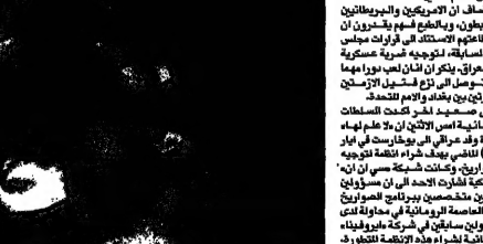
سيدة عراقية مع طفلها في مركز التوزيع الاعلانية في بغداد (يوهنا)